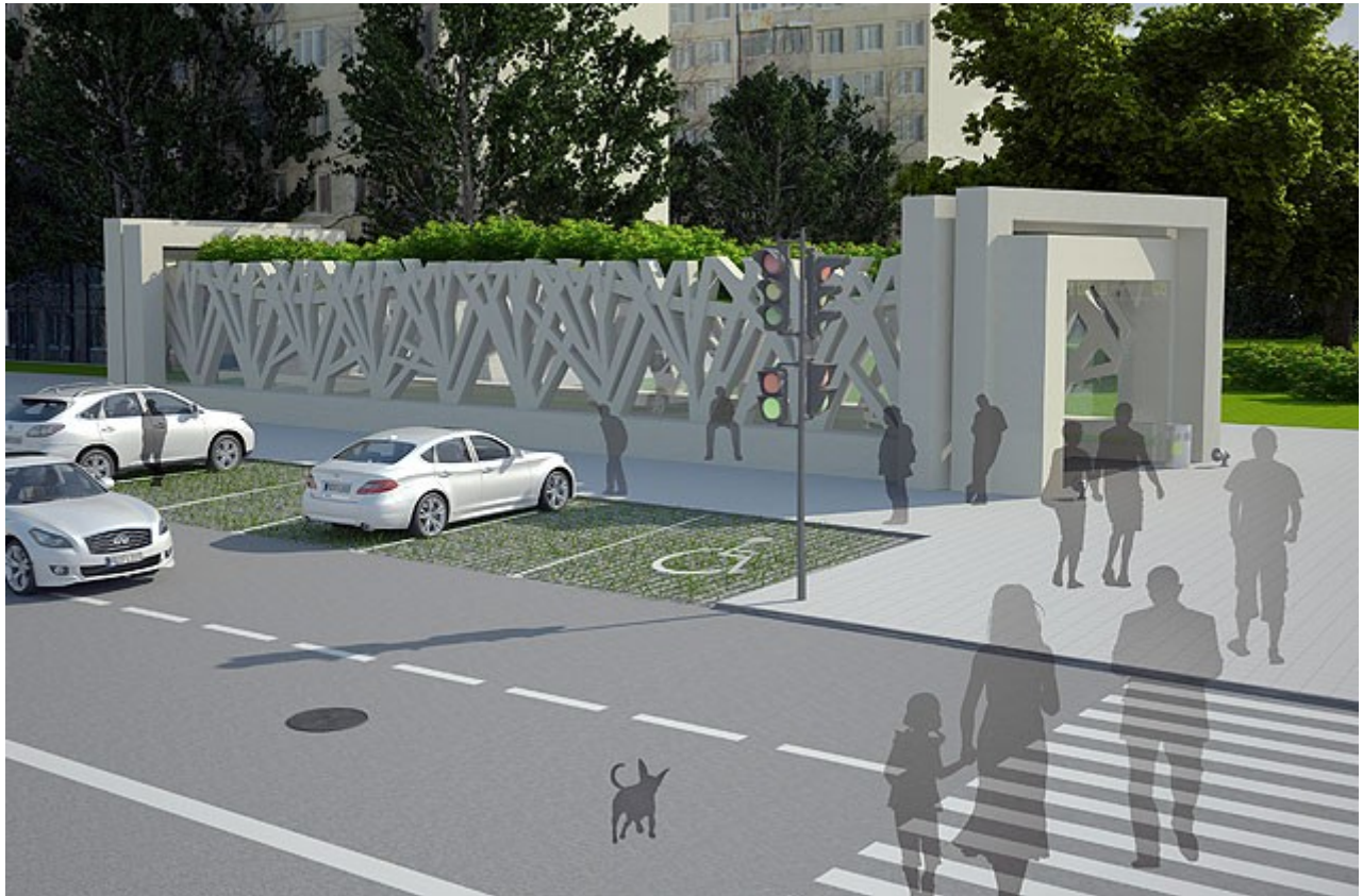
Станция метро "Техстекло".